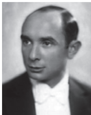
Ilustracja 3; Szymon Stanisław Kataszek (1898–1943)

Notatka prasowa sugeruje, że utwór Na falach Brdy powstał podczas pobytu autorów w Bydgoszczy na koncertach (dansingach) w hotelu „Pod orłem”, na specjalne zamówienie redakcji gazety. Kompozycję tę, ułożoną w formie jednozwrotkowej pieśni z refrenem (z akompaniamentem fortepianu), zamieszczono jako druk nutowy w „Dniu Bydgoskim” (por. ilustracja 4) wydając jednocześnie