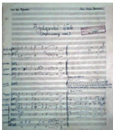
Ilustracja 8; Adam Jarzębski, Bydgoski walc (Zapomniany walc)

W archiwum radiowym zachowała się partytura zupełnie zapomnianego utworu zatytułowanego Bydgoski walc (Zapomniany walc) do tekstu Jana Bykowskiego, z muzyką nieznanego szerzej kompozytora Adama Jarzębskiego. (zob. ilustracja 8)