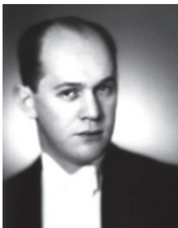
Ilustracja 2; Zygmunt Karasiński (1898–1973)

Historia piosenek o Bydgoszczy rozpoczyna się, podobnie jak dzieje polskiej piosenki, w okresie międzywojennym. 21 maja 1931 roku „Dzień Bydgoski” opublikował piosenkę zatytułowaną Na falach Brdy napisaną przez pierwszorzędną autorów przedwojennych polskich przebojów: Zygmunta Karasińskiego (1898–1973) i Szymona Stanisława Kataszka (1898–1943). Karasiński był już wówczas autorem popularnych szlagierów: Abram, ja ci zagram , Czy pamiętasz tę noc w Zakopanem? albo Czy pani mieszka sama? Jego współnikiem artystycznym był przyjaciel ze studiów Szymon Kataszek, specjalizujący się w aranżacjach w modnym wówczas stylu dixielandowym, którego obaj od 1925 roku byli propagatorami, prowadząc jeden z pierwszych polskich zespołów jazzowych – warszawski, dansingowy KIK. Był także autorem przebojów takich jak: Zula chce króla , Szkarłatna róża . O ile Karasińskiemu przypisywano genre sentymentalny , o tyle w utworach Kataszka podkreślano potoczność i żywiołowy temperament 17 .